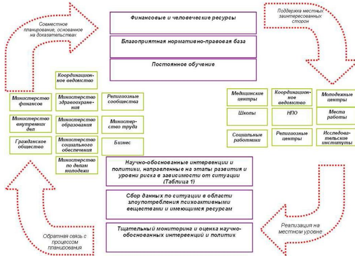
Рис. 1. Схема национальной системы профилактики наркомании