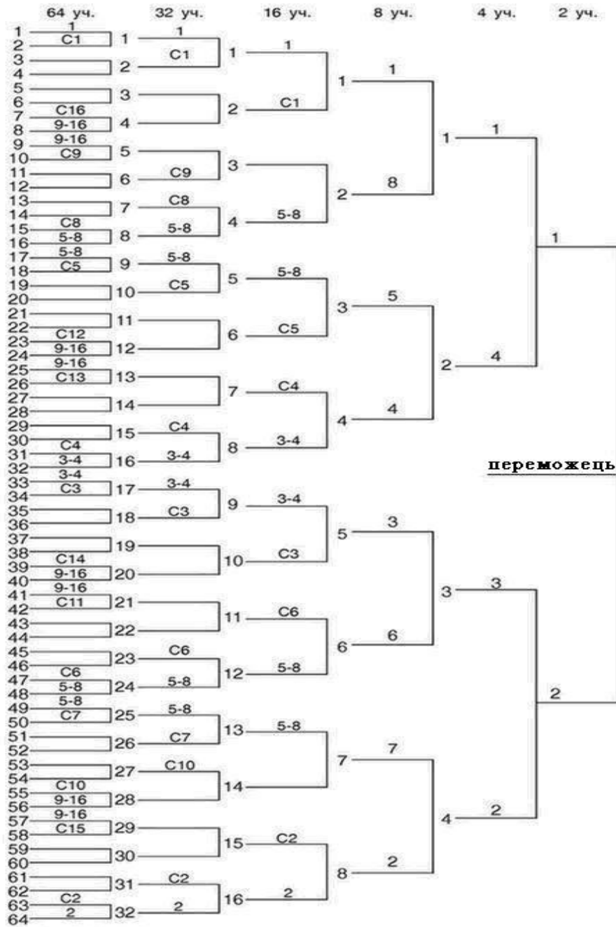
Таблиця розміщення учасників

1, 2, 3-4, 5-8 і т.і. - посіяні учасники під відповідними номерами C1, C2, C3 і т.і. - вільні номери та їх послідовність